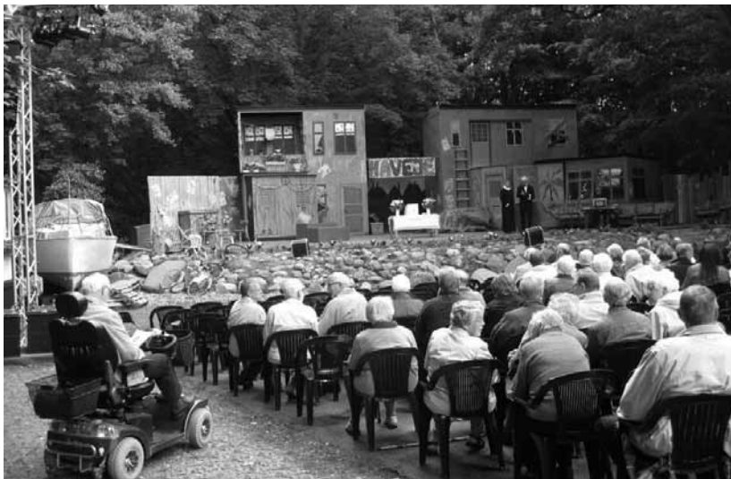
Friluftsgudstjenesten pinsedag 2011

Fælles friluftsgudstjeneste med indsættelse af hjælpepræst Juma Kruse Søndag d. 2. juni på friluftsscenen i Thorning