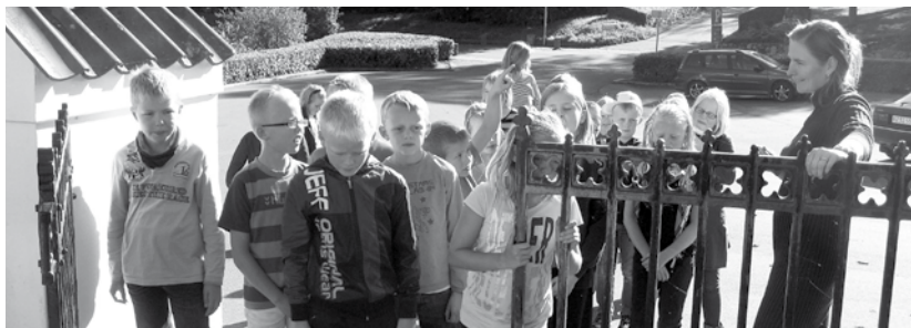
Minikonfirmander 2010 står ved lågen på vej ind for at se Thorning kirke