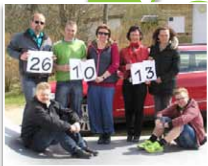
Arrangør: Blicheregnsens Festudvalg anno 2007