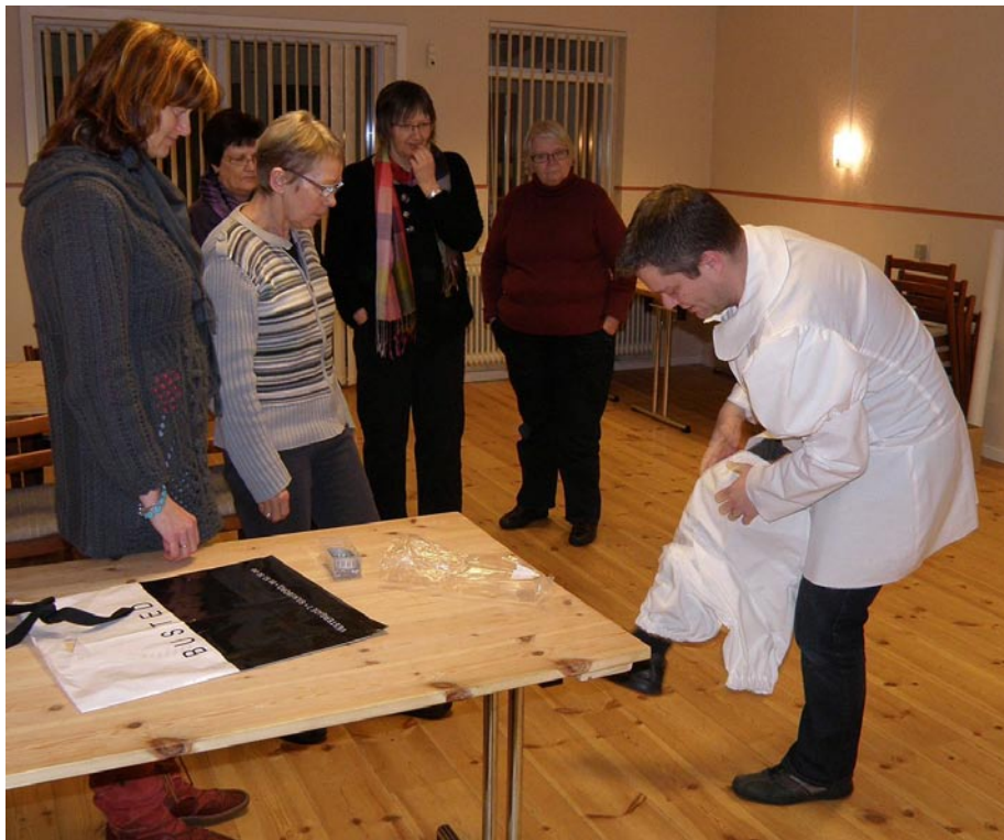
De kostumeansvarlige ser til medens "Prins John" prøver tøjet for første gang.